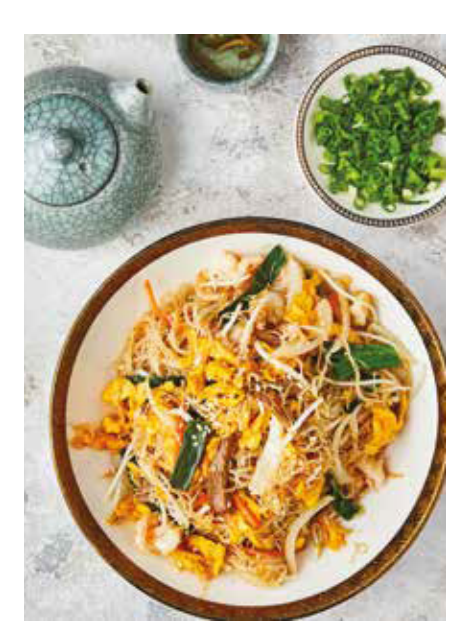
All Prices Are in Turkish Liras And Inclusive of All Taxes I 10% Service Charge Will Be Added To Your Check. Tüm Fiyatlar Türk Lirası Olup Tüm Vergiler Dahildir. I Hesabınıza %10 Servis Ücreti Eklenecektir. 所有价格为按照土耳其里拉为准包含税。1810的服务费将会加到您的发票上